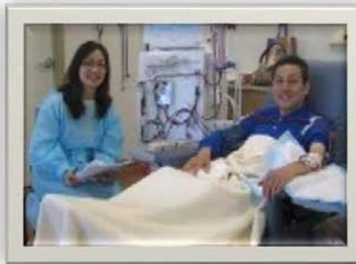
日本人 移植コーディネーター