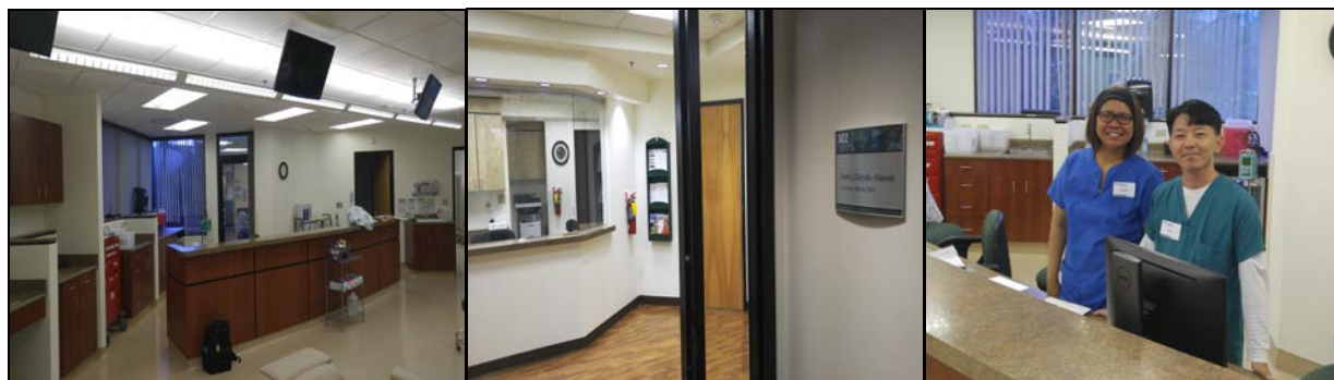
<透析センター-内の様子>