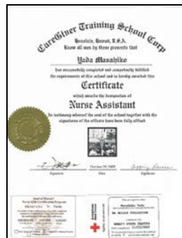
アメリカの看護師資格証書

最後に弊社は 創業（2006年）から11年間で Total : 928 名様 の透析患者をお世話してきた実績を持ち、ハワイで透析の手続きから医療支援まで提供できる”透析の専門家集団”として、旅行代理店では得られない専門的なサービスを提供できると自負しております。何かご不明な点がございましたら、いつでもお問い合わせください。ご連絡をお待ちしております。