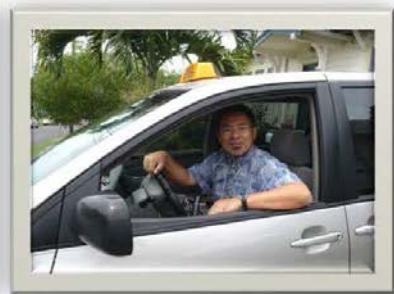
日本人 ドライバー

最後に弊社は 創業（2006年）から11年間で Total : 928 名様 の透析患者をお世話してきた実績を持ち、ハワイで透析の手続きから医療支援まで提供できる”透析の専門家集団”として、旅行代理店では得られない専門的なサービスを提供できると自負しております。何かご不明な点がございましたら、いつでもお問い合わせください。ご連絡をお待ちしております。